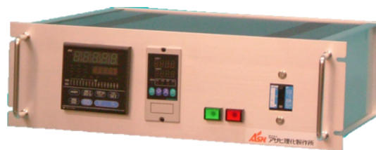
専用温度コントローラー 19ラック・JIS取手付480タイプ 定電力位相制御サイリスター搭載

1500°Cまでの高温管状炉です。軽量小型化した為に使い易く、消費電力も少なくて済みます。また垂直にての使用も可能です。より温度精度の良いサイリスター定電力位相制御を組み合わせることにより高性能な装置としてお使い頂けます。