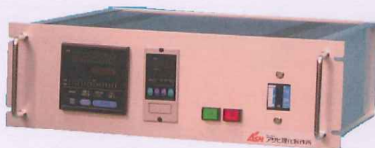
専用温度コントローラー 19ラック・JIS取手付480タイプ 定電力位相制御サイリスター搭載

1500°Cまでの高温管状炉です。軽量小型化した為に使え易く、消費電力も少なく済みます。また垂直にての使用も可能です。より温度精度の良いサイリスター定電力位相制御を組み合わせることにより高性能な装置としてお使い頂けます。